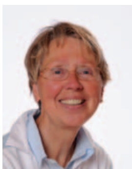
Els Schelfhorst Groep 1/2b