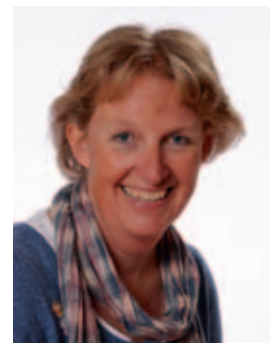
Ine Pennink Groep 1/2a